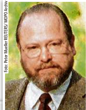
Kam vor 30 Jahren nach Zahlung von 30 Millionen Mark Lösegeld frei: Jan Philipp Reemtsma