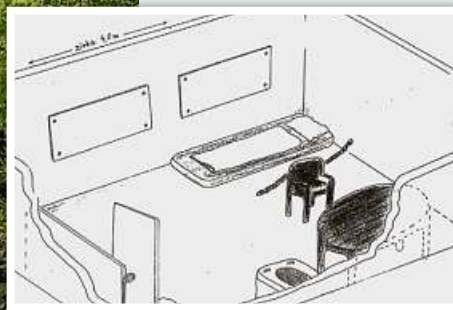
Im Keller dieses Hauses in Garlstedt bei Bremen wurde Jan Philipp Reemtsma 33 Tage lang von Entführern festgehalten: Reemtsmas rechtes Bein war mit einer zwei Meter langen Stahlkette an der Wand befestigt.