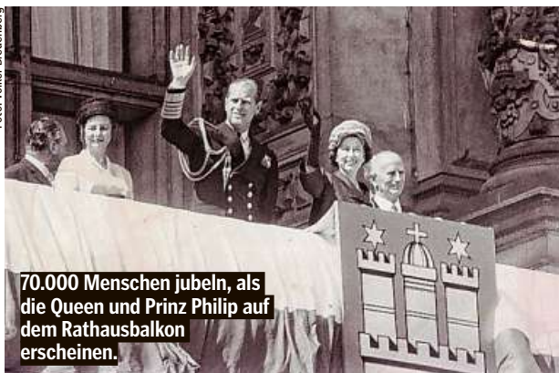
70.000 Menschen jubeln, als die Queen und Prinz Philip auf dem Rathausbalkon erscheinen.