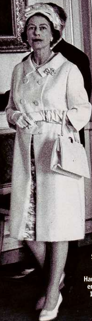
Es war ein Staatsbesuch der Superlative: Vor 60 Jahren besuchte Queen Elizabeth II. Hamburg. Dieses Foto entstand am 28. Mai 1965 im Hamburger Rathaus.