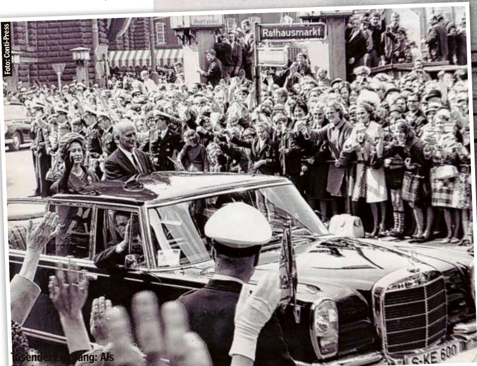
Resendert: Der Empfang: Als Elizabeth II. und Bürgermeister Paul Nevermann (SPD) am Rathaus vorfahren, jubelt die Menge.

28.5.1965 Der Besuch von Elizabeth II. bringt ans Tageslicht, dass Paul Nevermann eine Affäre hat. Die Springer-Pressen schießt sich auf ihn ein