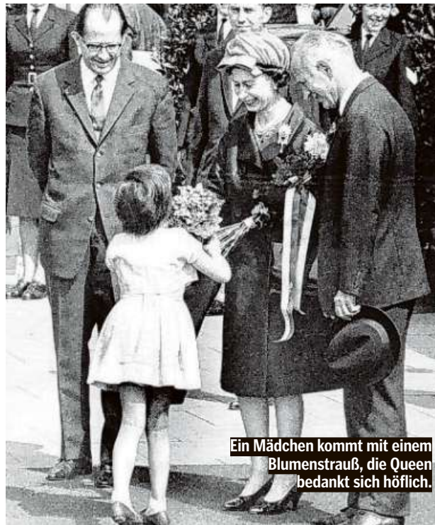
Ein Mädchen kommt mit einem Blumenstrauß, die Queen bedankt sich höflich.