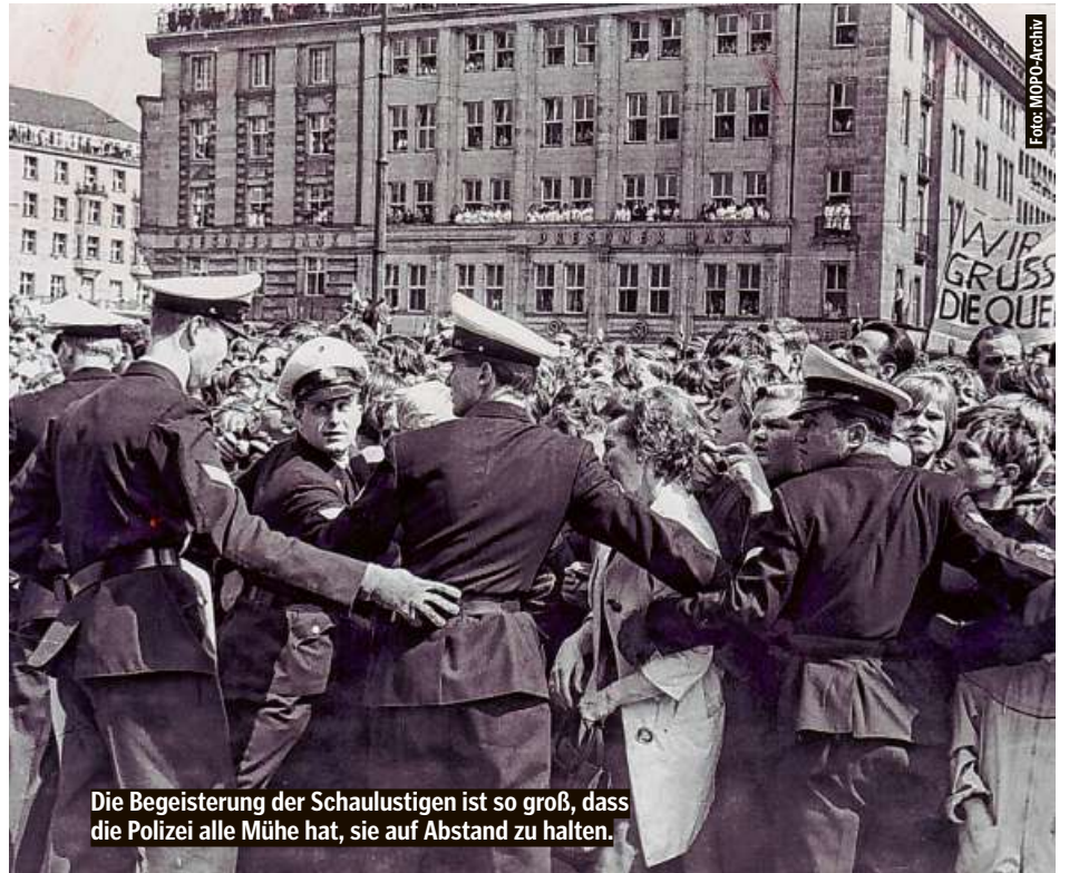
Die Begeisterung der Schaulustigen ist so groß, dass die Polizei alle Mühe hat, sie auf Abstand zu halten.