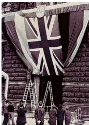
Hamburg im Großbritannien-Fieber. Das Rathaus ist mit dem Union Jack geschmückt.