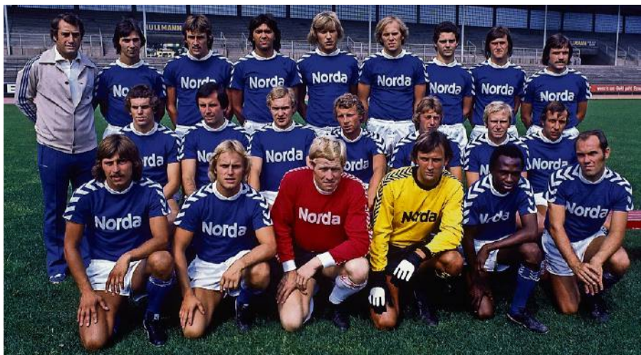
Ade Grün-Weiß: Wenige Tage nach dem Abschluss der Verhandlungen zwischen Werder und Nordsee posierte das Bundesliga-Team erstmals in den blauen Trikots.

► So geht's weiter: Der zweite Teil der sechsteiligen Serie „Spur des blauen Werder-Trikots“ erscheint am 21. August.