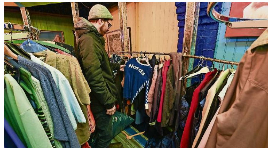
Im Rondell eines alten Jahrmarkt-Karussells stoße ich auf das blaue Trikot mit dem Norda-Schriftzug. Der Flohmarkt Roter Sand findet an jedem Wochenende in drei alten Hafenhallen statt.