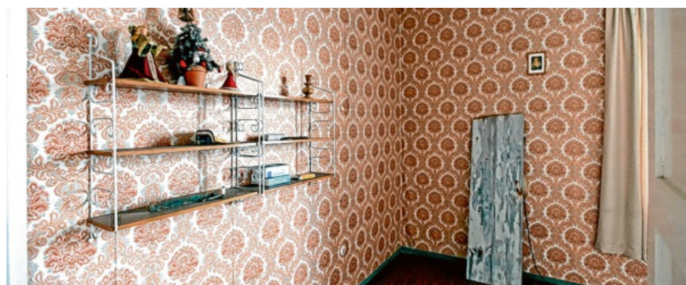
Zuletzt wurde das Gebäude als Wohnhaus genutzt.