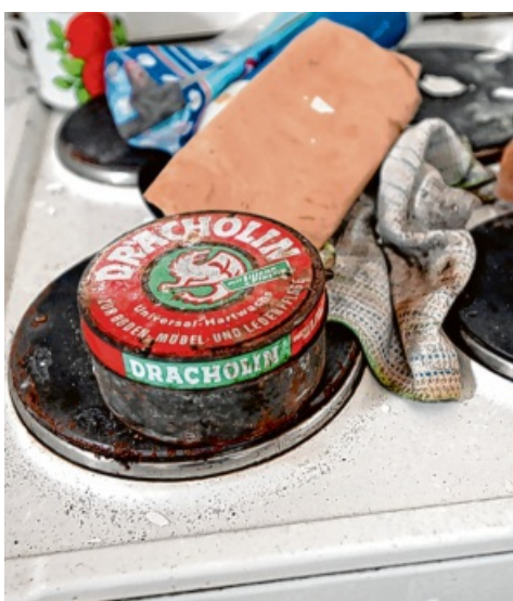
Hartwachs und Wischtücher: Vieles erinnert im Lost Place an die letzten Bewohner.

Fotos von der ehemaligen Judenschule in Fischach sehen Sie hier: