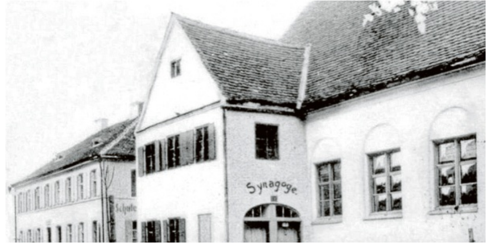
So sah die Judenschule (hinten) früher aus. Die Schriftzüge wurden wohl nachträglich ins Bild retuschiert.