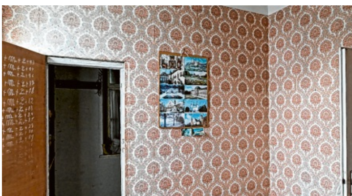
Sehnsuchtsorte und Urlaubsziele: An einer Wand hatte ein Bewohner Postkarten aufgehängt.