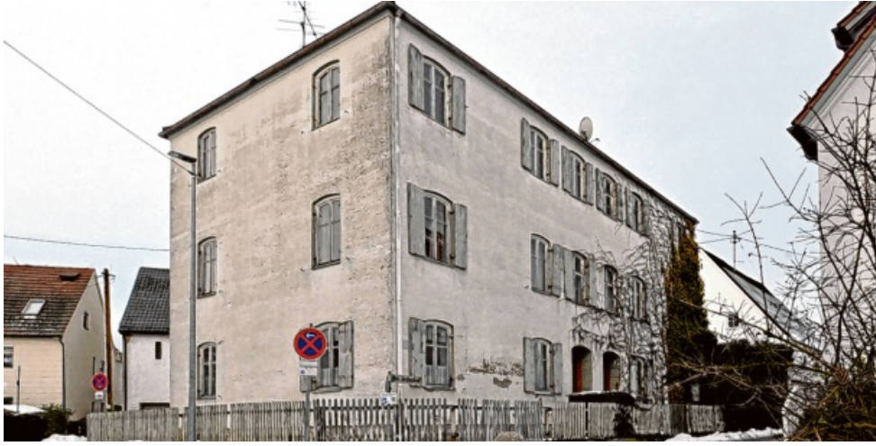
Seit Jahren steht die ehemalige jüdische Schule von Fischach leer. An der höchsten Stelle im alten Ortskern von Fischach steht die ehemalige jüdische Schule.