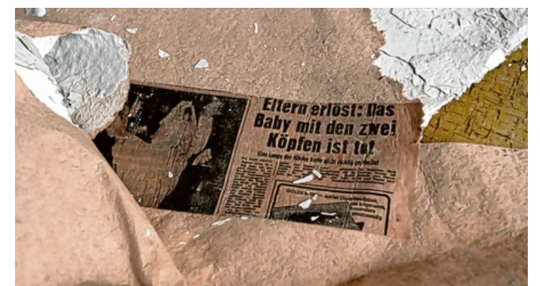
Von den Wänden blättern die Tapeten ab. Zum Vorschein kommen alte Zeitungen.