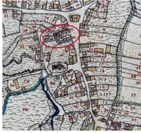
Die Uraufnahme (1808-1864) zeigt den Fischacher „Judenhof“. Südlich davon befindet sich die Kirche.