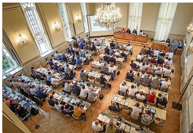
Im großen Saal des Landratsamtes Bautzen konstituierte sich am Montagabend der im Mai neu gewählte Kreistag.