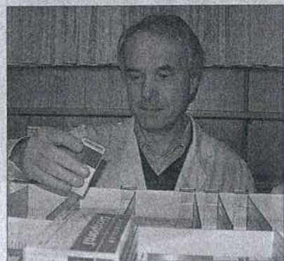
Mehr als 2000 Medikamente hat der Apotheker in Schubladen und Regalen griffbereit. Was nicht da ist, wird sofort bestellt.