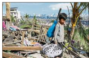
»Rai« hat gewütet

Manila. »Rai«, der bisher stärkste Taifun dieses Jahres auf den Philippinen, hat bei seinem Durchzug eine Spur der Verwüstung hinterlassen und mindestens 142 Todesopfer gefordert. Besonders be-