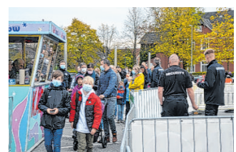
Nachweis-Kontrolle beim Herbstmarkt.

AURICH Die 2G-Regelung, die in Diskotheken, manchen Restaurants und beim Auricher Herbstmarkt zum Einsatz kommt, soll das Sicherheitsgefühl der Besucher verstärken und Zusammenkünfte vieler Menschen wieder möglich machen. Doch zeigt die Erfahrung eines Lesers Lücken im Kontrollsystem auf. Daniel Grone-